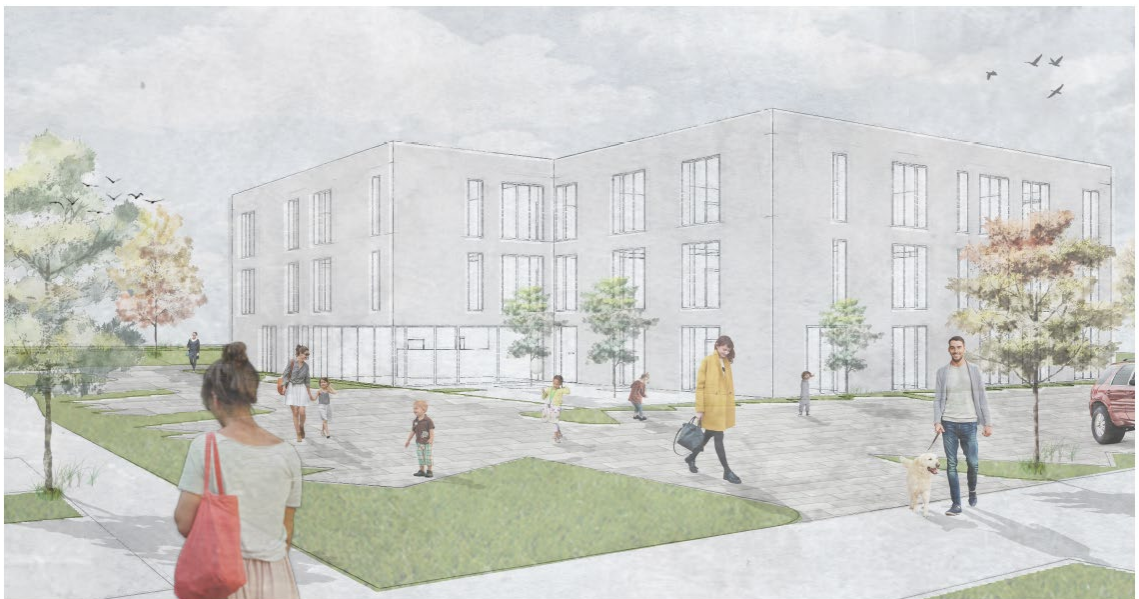
Ansicht Neues Ärztehaus

Die für die Patienten und Mitarbeiter notwendigen Stellplätze und Fahrradabstellplätze werden um das Gebäude herum angeordnet und sind über die Ringstraße sowie über die geplante Erschließung für das neue Baugebiet „Gleisdreieck“ mit drei Ein- bzw. Ausfahrten erschlossen. Geplant sind 50 Stellplätze für Pkw sowie 74 Abstellplätze für Fahrräder.